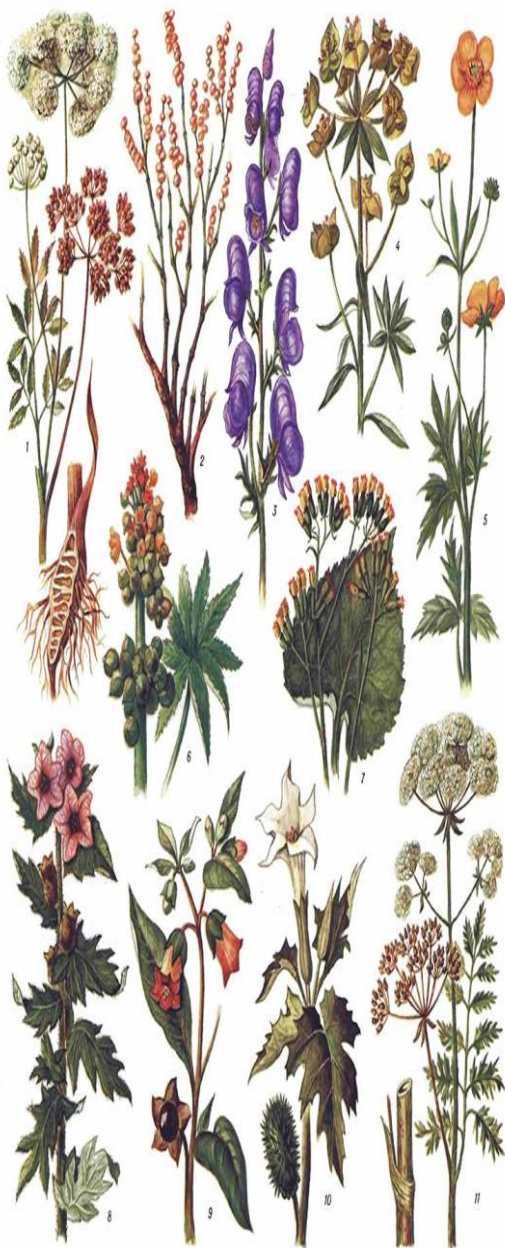
Ядовитые растения: 1—век кровный; 2—выбывок (яковин) белый; 3—аконит (борец) дугнгароль; 4—молочай огородный; 5—лотик ерой; 6—клевчик обыкновенный; 7—кровошник широколистный; 8—белена чёрная; 9—красавка (вельдрина) обыкновенная; 10—дурман обыкновенный; 11—болитолов пятнистый.

Обязательно позаботьтесь о том, чтобы на участке не было ядовитых растений, таких как морозник, безвременник, молочай, аконит, клеццевик, борщевник, волчий ягодник, бобовник. Ядовитые вещества содержат олеандр, дурман, майский ландыш, глициния. Помните, что к «агрессивным» относятся растения, которые выделяют много пыльцы, ведь пыльца - один из самых распространённых аллергенов. В этом списке астры, хризантемы, кореопсисы, маргаритки, бархатцы, ноготки, а также ива, сирень, берёза, клён. Даже у младших школьников эти растения могут вызвать серьёзные отравления. Кстати, если даже на вашем дачном участке они не растут, полезно пройтись по дачам соседей (с их разрешения, конечно!) и показать ребёнку, каких растений стоит опасаться.